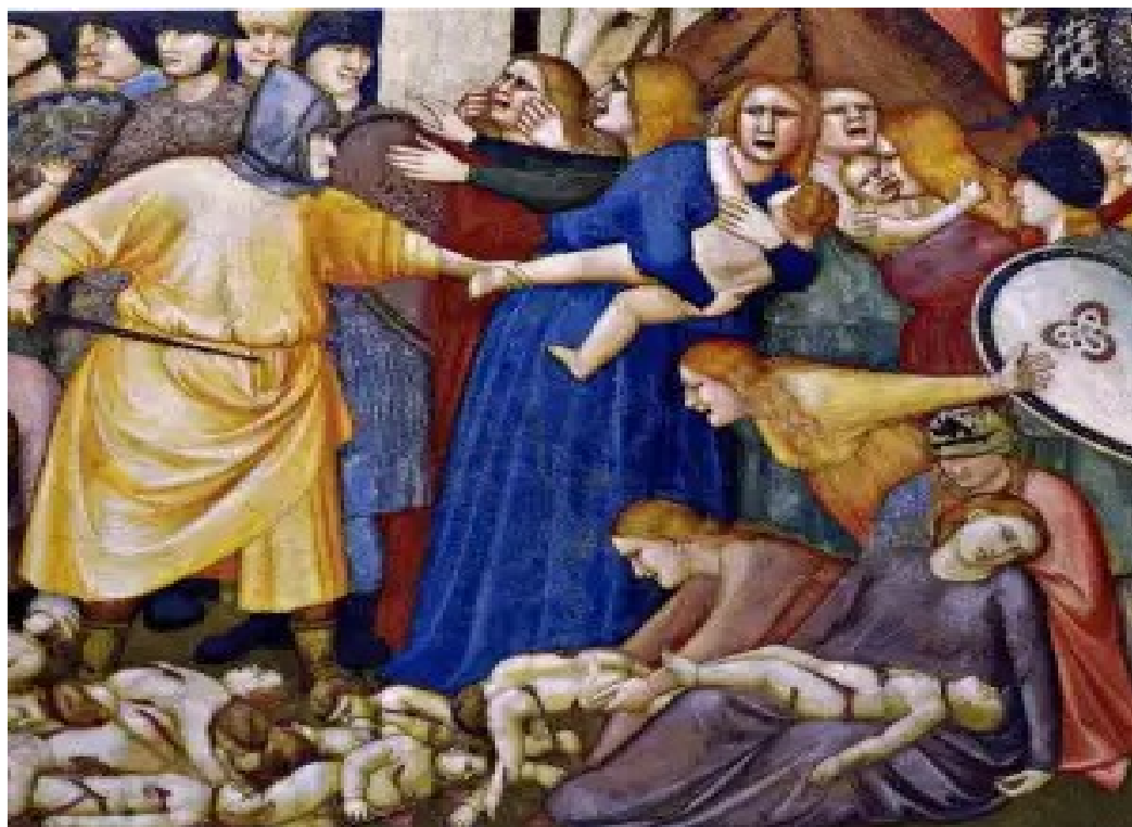
Giotto: La strage degli innocenti, transetto destro della basilica inferiore di Assisi